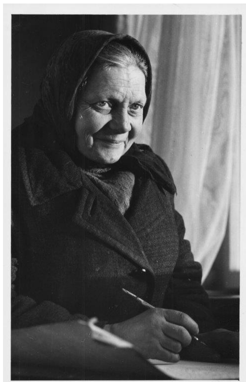
Zdjęcie przedstawiające artystkę

MARIA WNĘK /ur. 15.06.1922 - zm.12.04.2005/